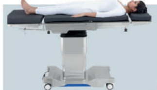
Réglage de la hauteur haut/bas