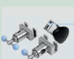
Crochets de fixation