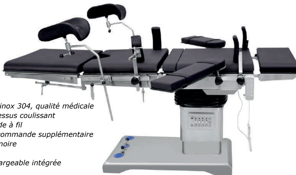
Table d'opération électrique compatible avec l'arceau à C, avec dessus coulissant