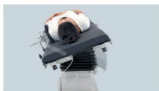
Inclinaison latérale gauche/droite